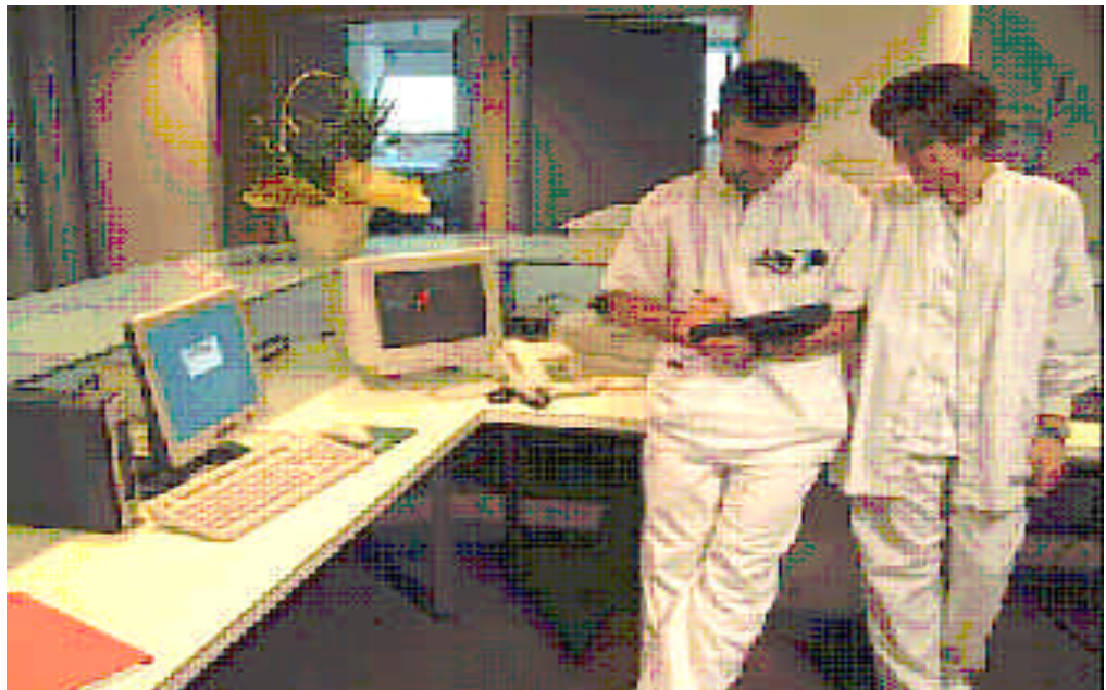
Enfermeras usando el Webpad en una Unidad de Hospitalización

Es decir, a través del Tablet se puede acceder a toda la información médica, cuidados previos, resultados de pruebas complementarias... y además se pueden seguir recopilando datos de interés sobre el usuario a través del plan de acogida, la valoración inicial(física y por necesidades), así como registrar constantes vitales y otras mediciones prescritas. Con esta información, se identifican los problemas de autonomía, datos de interés, problemas de independencia y de colaboración y se inicia la elaboración del plan de cuidados, que también podrá actualizarse continuamente cuando la persona lo requiera. ¡Y todo ello a través del Tablet PC y Webpad!