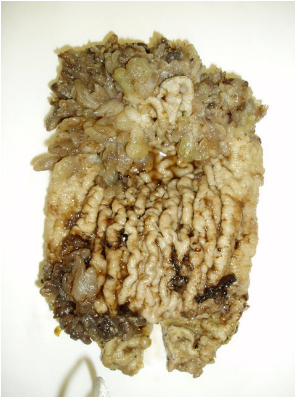
Figura 1: Múltiples pólipos agrupados en fundus y antro